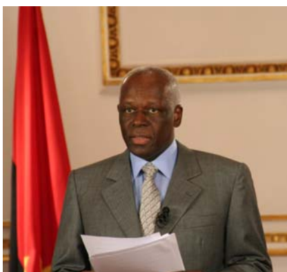
Presidente da República de Angola José Eduardo Dos Santos

No dia 5 de Setembro próximo, a partir das sete horas da manhã, vamos ter em