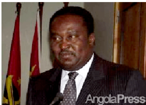
Primeiro-ministro, Fernando da Piedade Dias dos Santos