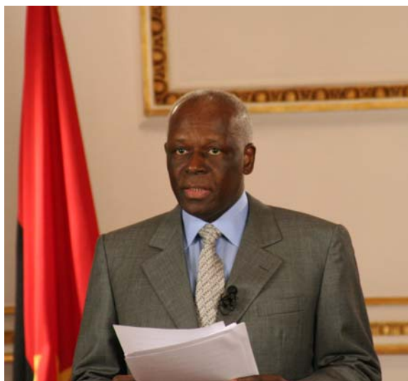
Sua Excelência José Eduardo Dos Santos, Presidente da República de Angola