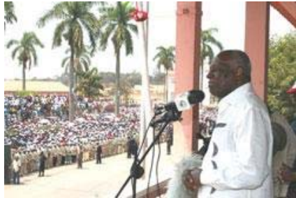
Presidente da República de Angola José Eduardo Dos Santos

O Presidente da República, José Eduardo dos Santos, anunciou em Malanje, que esta província terá uma "grande desenvoltura" nos próximos meses, com a implementação de projectos agrícolas e sociais, entre os