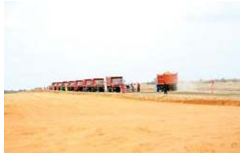
Obras para uma das pistas do novo aeroporto internacional de Luanda