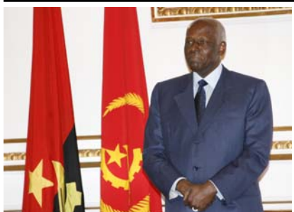
Presidente da República de Angola José Eduardo Dos Santos

O Presidente da República de Angola, José Eduardo dos Santos, traçou (03/10), em Luanda, os grandes objectivos do Governo e as responsabilidades do partido no poder (MPLA), vencedor, das eleições legislativas de 5 de Setembro de 2008.