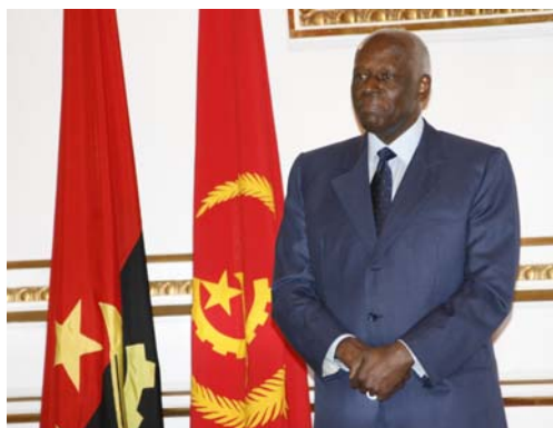
Presidente da República de Angola José Eduardo Dos Santos

O Presidente da República de Angola, José Eduardo dos Santos, traçou (03/10), em Luanda, os grandes objectivos do Governo e as responsabilidades do partido no poder (MPLA), vencedor, das eleições legislativas de 5 de Setembro de 2008.