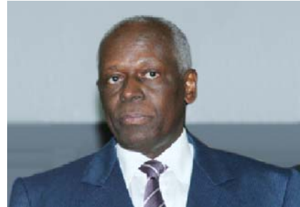
Chefe de Estado, José Eduardo dos Santos, felicitado pelo Banco Mundial devido ao crescimento económico de Angola

Informou que os sectores da saúde, educação, energia, agrícola e pesca constituem prioridades do Banco Mundial.