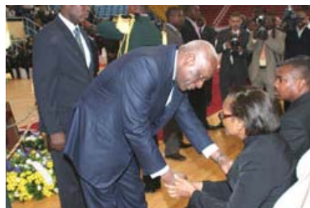
Chefe de Estado, José Eduardo dos Santos, rende homenagem a Teta Lando e cumprimenta a família

"Teta Lando era um músico de grande talento e um cantor exímio, que durante décadas produziu canções que enriqueceram o nosso património cultural, merecendo figurar entre os mais destacados