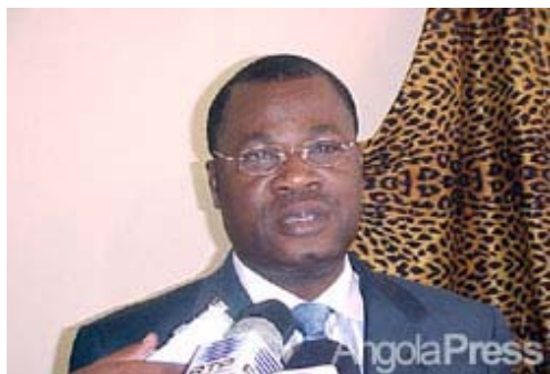
Ministro das Relações Exteriores, João Miranda

O ministro das Relações Exteriores, João Miranda, considerou, em Luanda, um êxito o périplo que o levou ao Chile, Paraguai, Uruguai e Brasil.