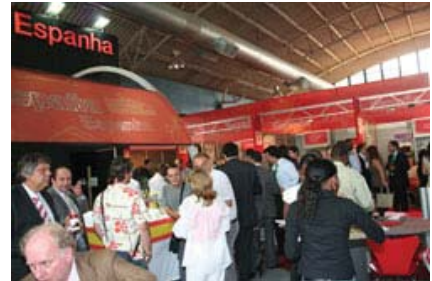
População na Feira Internacional de Luanda, antes do seu encerramento

O evento contou com as participações, além dos expositores nacionais, do Botswana, Zimbábwe, Egipto, Portugal, Paquistão, Brasil, Espanha, Alemanha, China, Singapura, Turquia e Namíbia.