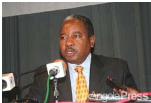
Ministro das Finanças de Angola, José Pedro de Morais

A entrega do prémio de melhor ministro das Finanças em 2007 de Africa, ao titular da pasta das Finanças de Angola, José Pedro de Morais, pela prestigiada revista "The Banker" do grupo Financial Times, constitui destaque noticioso.