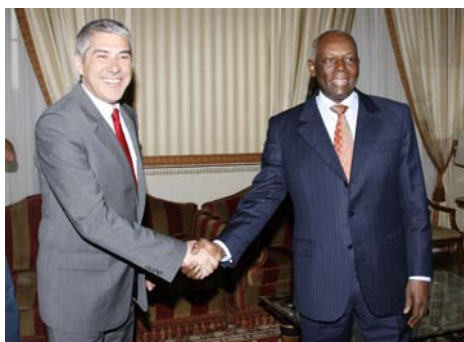
Primeiro-ministro Português José Sócrates em audiência com o Presidente José Eduardo dos Santos

O primeiro-ministro português, José Sócrates, reafirmou, em Luanda, o desejo do seu país em continuar a cooperar com Angola nos mais variados domínios.