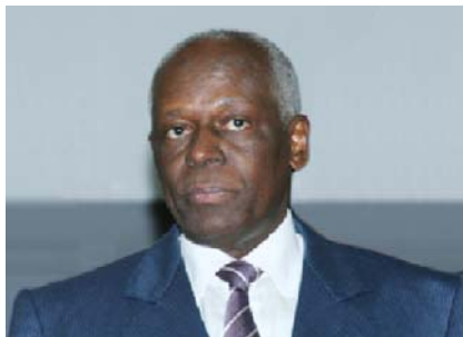
Presidente da República de Angola José Eduardo Dos Santos

“Estamos aqui para felicitar o Presidente da República, José Eduardo dos Santos, pela sua contribuição na estabilidade e pela boa gestão macroeconómica”, disse a directora de Gestão do Banco Mundial, Ngozi Okonjo, em declarações à imprensa, no final de uma audiência concedida pelo primeiro-ministro, Fernando da Piedade Dias dos Santos.